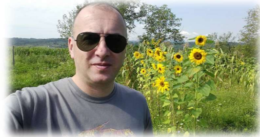
Piše: Aleksandar Perović

Kraj prethodne i početak tekuće godine obilježilo je aerozagađenje, što je negdje očekivano za period sezone grijanja, pa je logično da se u ovom broju Ekologa bavimo tom temom.